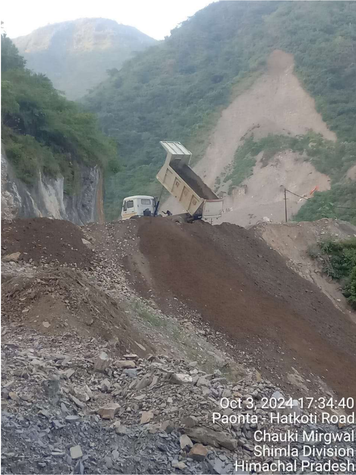
Oct 3, 2024 17:34:40 Paonta - Hatkoti Road Chauki Mirgwal Shimla Division Himachal Pradesh