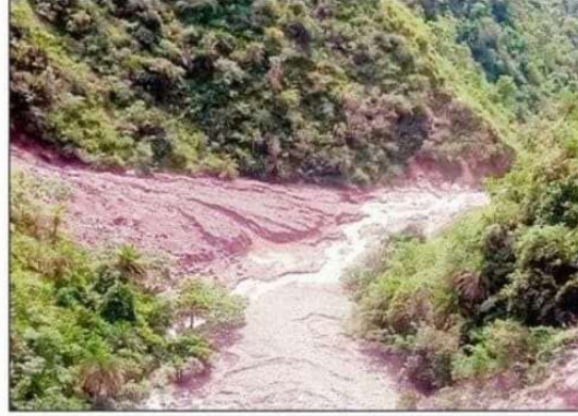
पेयजल स्रोतों में की गई मलबे की अवैध डंपिंग।

एनजीटी ने 24 जुलाई की सुनवाई में सड़क निर्माण में इस्तेमाल होने वाले मलबे को जंगलों और नदी तटों पर फेंकने पर सख्त नाराजगी जाहिर की थी। इसके बावजूद 18 अक्टूबर को मामले की अगली सुनवाई से पहले भी मलबे का उचित निपटारा नहीं